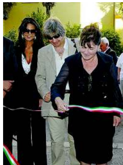
»» Un momento dell'inaugurazione