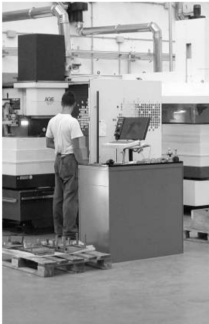
»» L'interno di un'azienda meccanica

Sarà una battaglia a scacchi, in cui l'ultima mossa toccherà alla presidente Marini. Tenendo conto che pressioni, "suggerimenti" e fautori di equilibri e alchimie, sono tutti già al lavoro. Le variabili sono molte e di diversa natura, come quasi sempre avviene quando politica ed economia vanno a sovrapporsi ed intrecciarsi. Sulla partita d'autunno in molti, sui fronti più diversi, hanno accesso i riflettori, perché una cosa è chiaro fin da ora: nessuno vuole rimanere semplicemente alla finestra. In ballo c'è la redistribuzione di una bella fetta di potere.